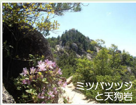
ミツバツツジ と天狗岩