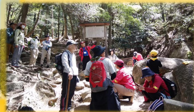
春の金勝アルプス・金勝寺ハイキングの様子