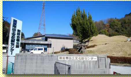
栗東市出土文化財センター